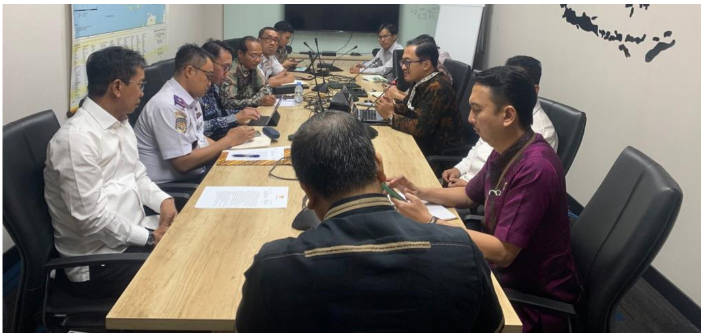
Pertemuan di Kantor Dirjen Perhubungan Udara Kemenhub RI