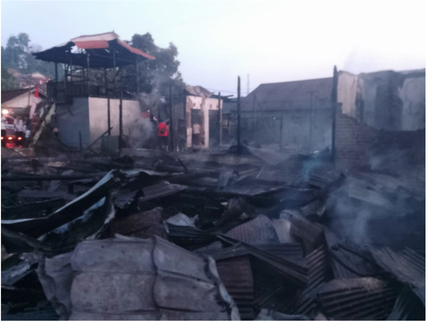
Kondisi bangunan yang hangus terbakar di Desa Loa Janan Ulu.