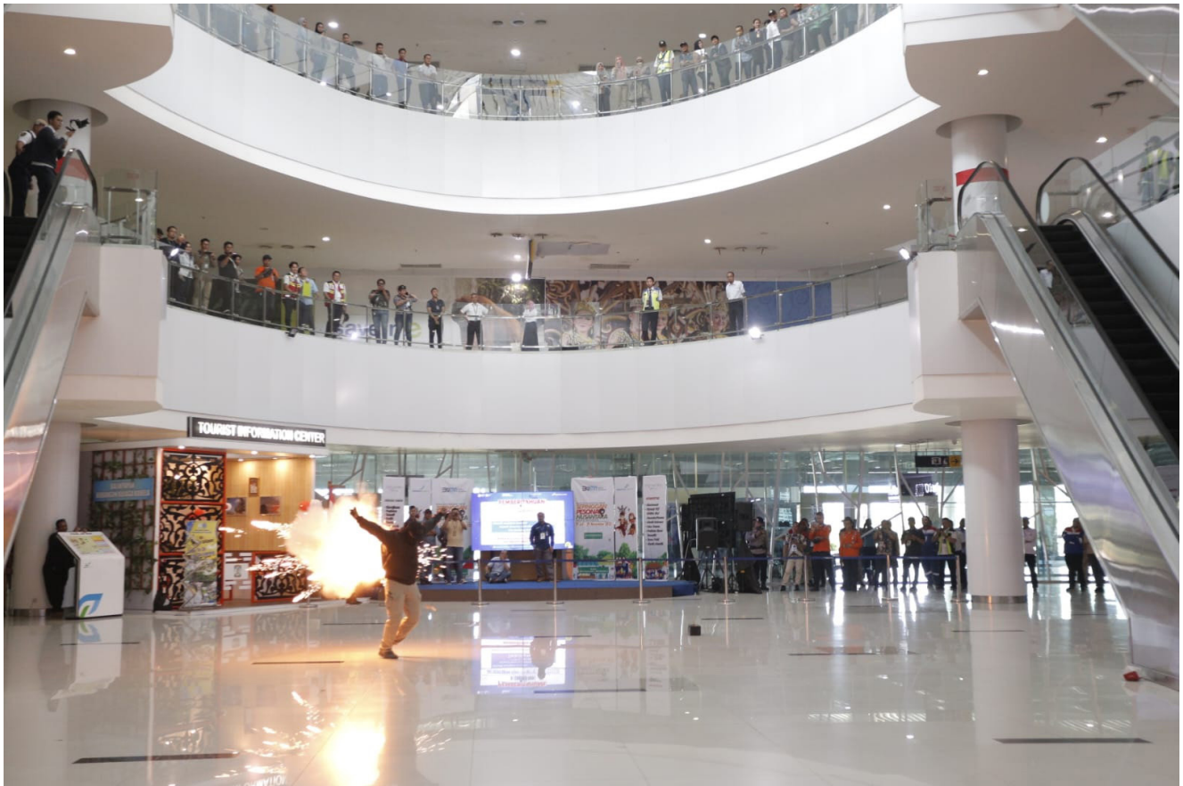
Simulasi latihan PKD berskala besar yang menunjukkan bom meledak di Bandara SAMS Sepinggang Balikpapan, pada Kamis (24/8).