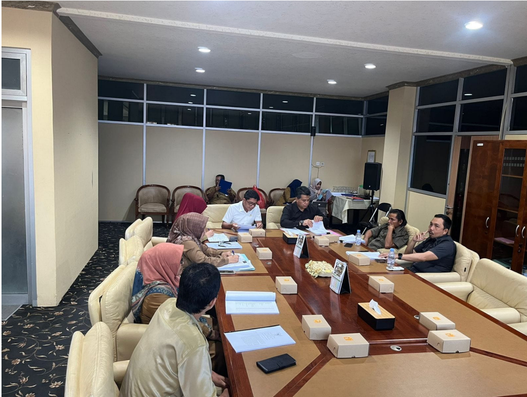
Pembahasan Raperda oleh Pansus I DPRD Kabupaten Paser