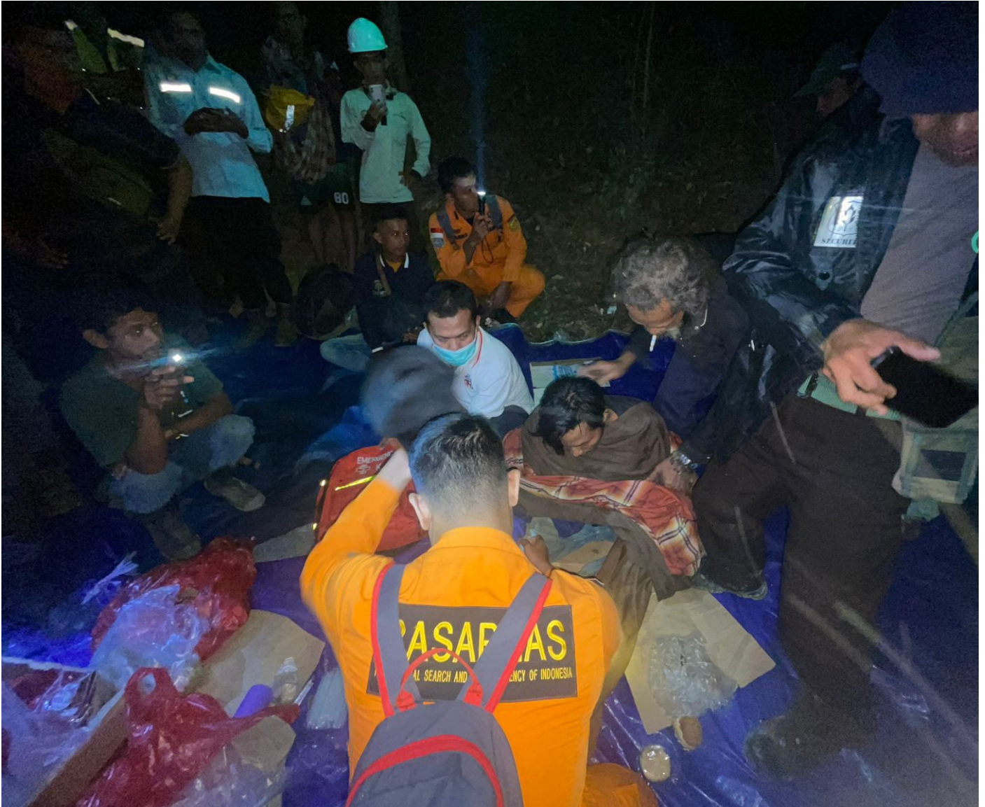
Situasi saat korban dievakuasi oleh tim SAR Gabungan.