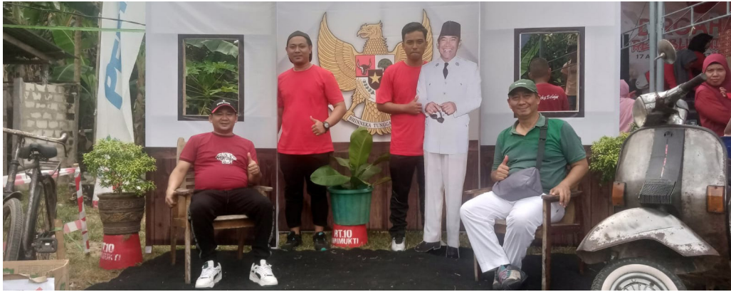
Salah satu spot foto di pusat gelaran peringatan HUT ke-78 RI di Desa Girimukti.