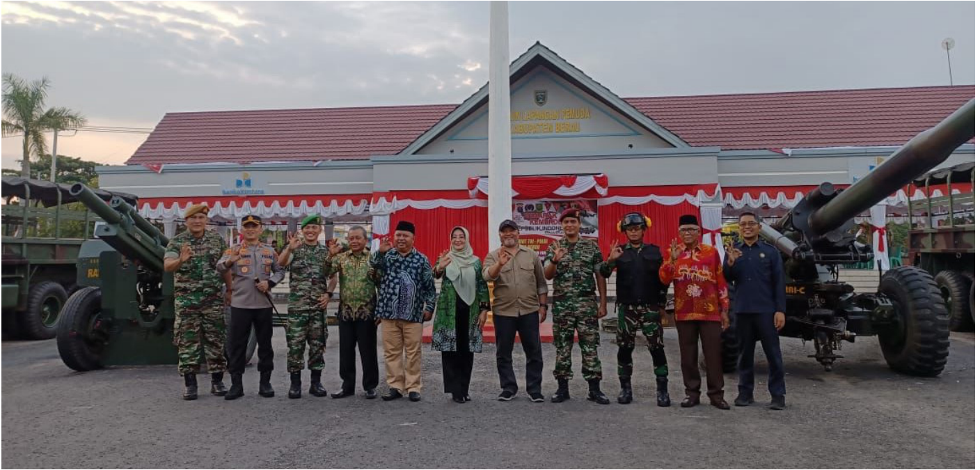
Jajaran Forkopimda Berau berfoto bersama Alutsista pertahanan dan keamanan, di Lapangan Pemuda Tanjung Redeb.