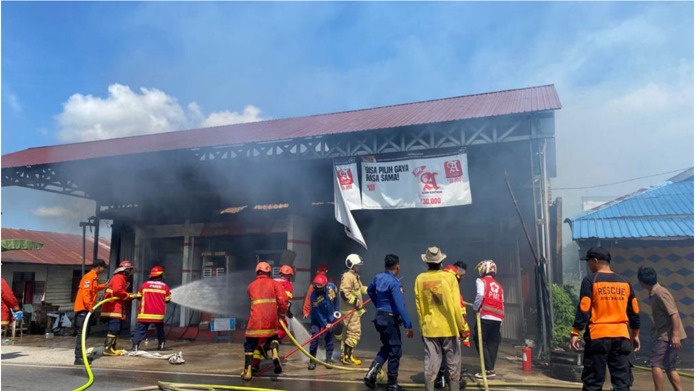
Kebakaran Pertamina di Desa Tanah Periuk beberapa waktu lalu.