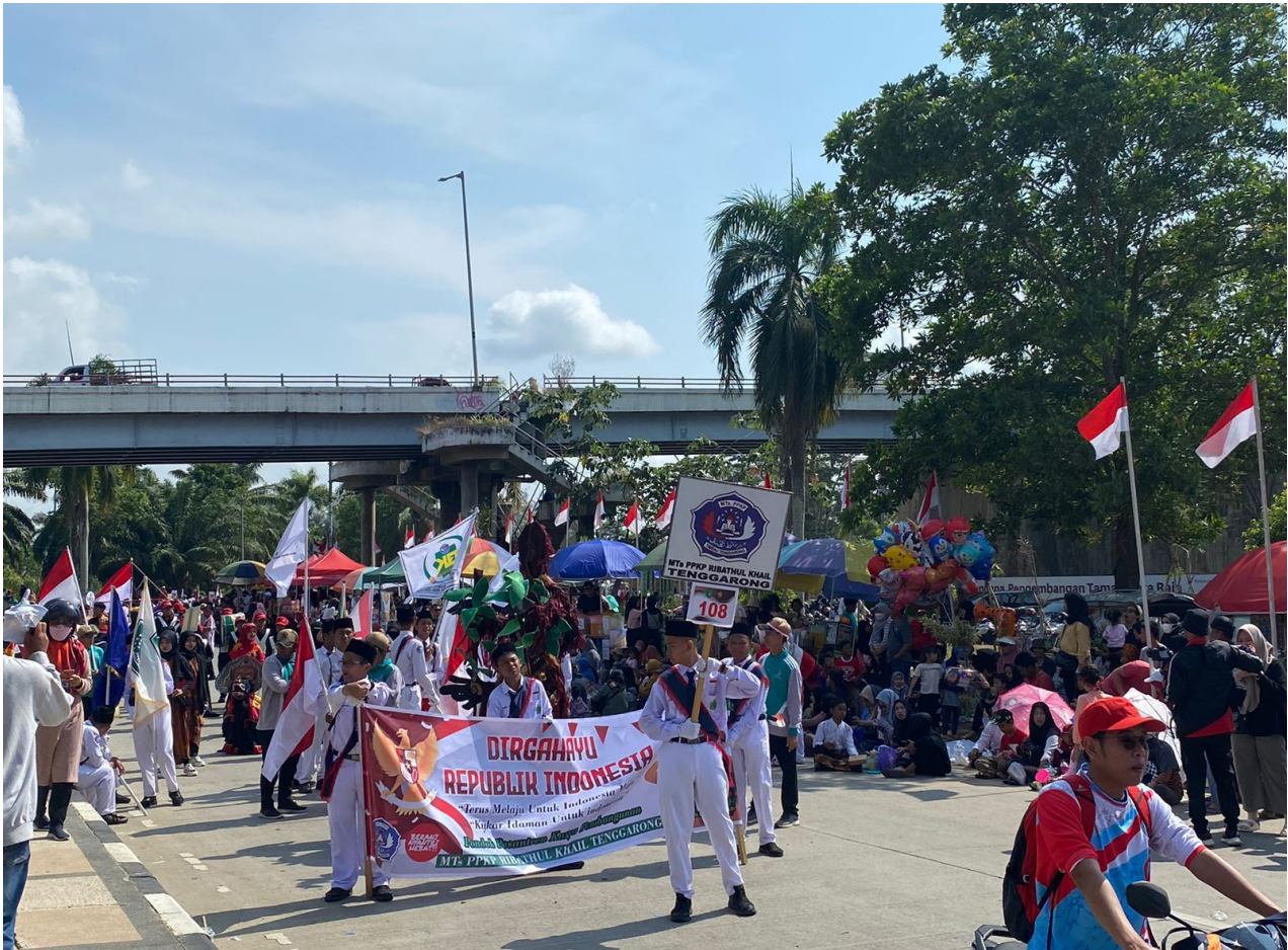
Suasana Pawai Pembangunan dan Budaya 2023 di Kukar.