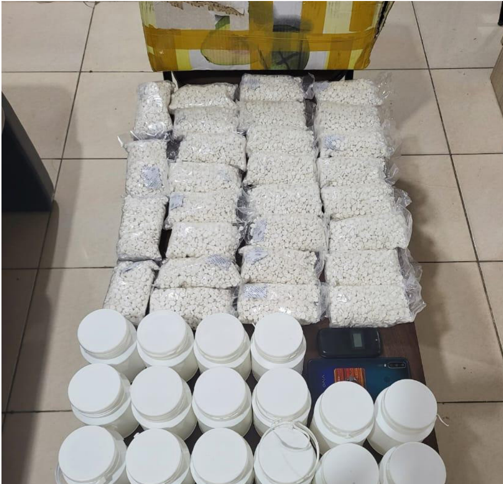
Pelaku AH dan MO beserta barang bukti 28 ribu butir Double L yang diamankan Polres Kukar.