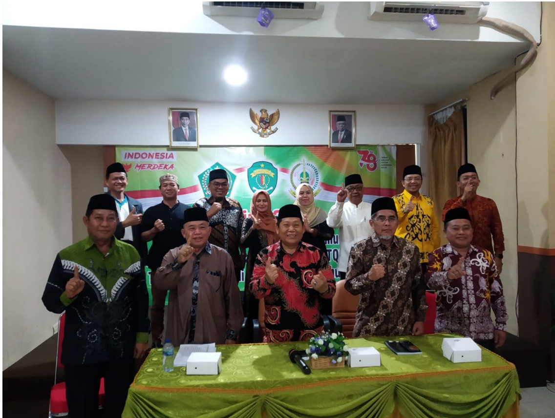
Pemusatan Latihan STQH Kaltim: Persiapan Menuju Prestasi di Tingkat Nasional