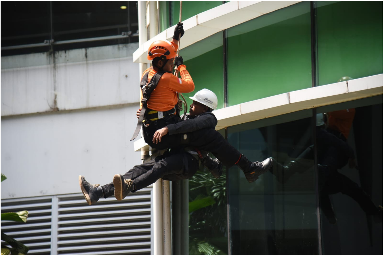
Simulasi penanggulangan keadaan darurat (PKD) di Bandara SAMS Sepinggang Balikpapan.