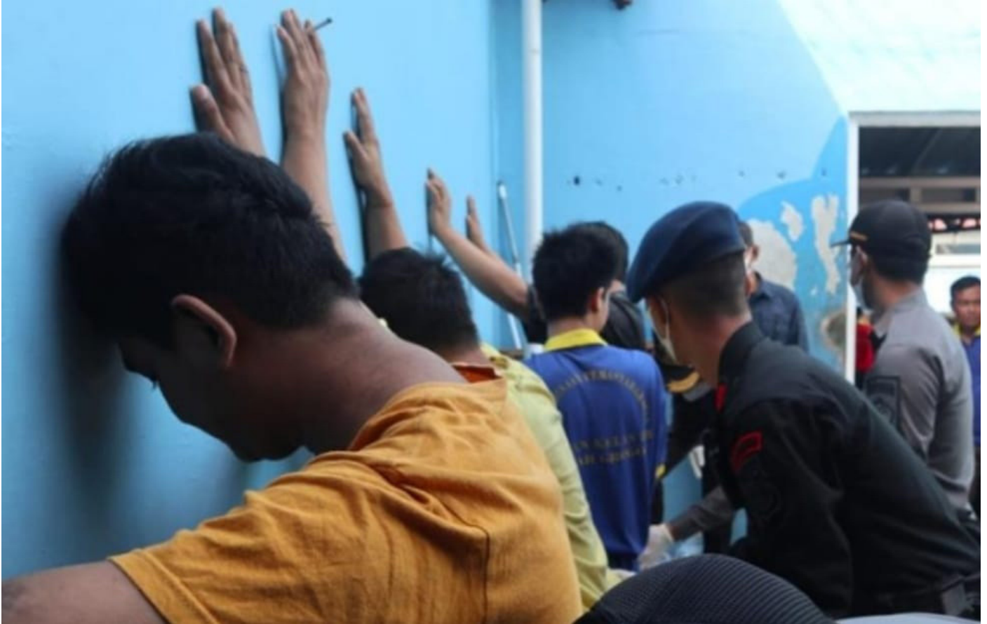
Pengeledahan oleh Owtugas di blok hunian WBP