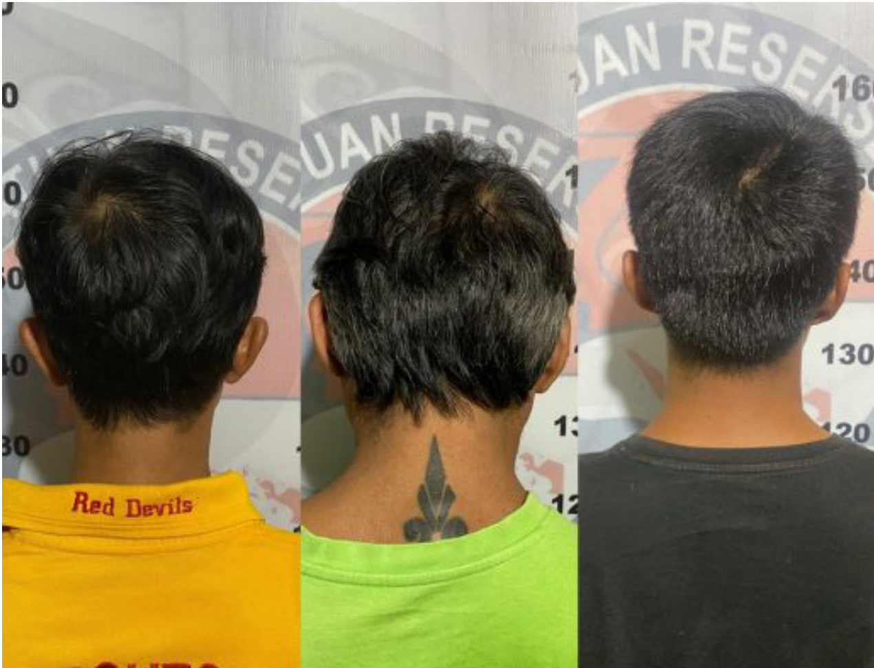
Ketiga pelaku sudah diamankan di Mako Polres Bontang.