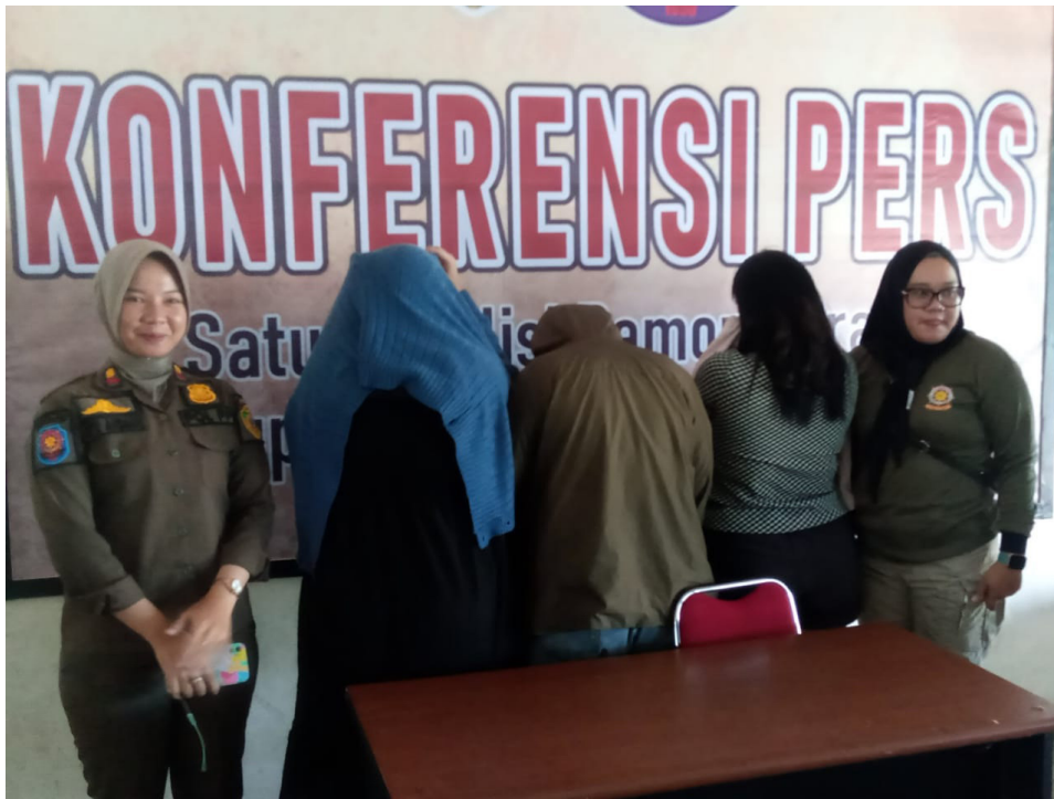
Tiga tersangka PSK saat diamankan di Mabes Satpol-PP PPU.