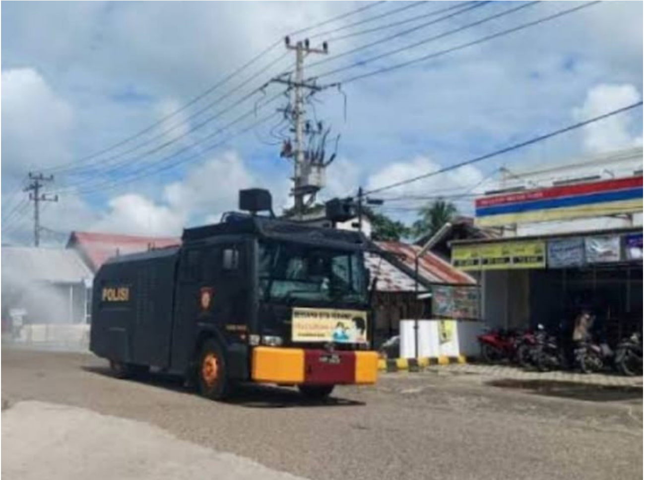
Unit water canon milik Polres Paser