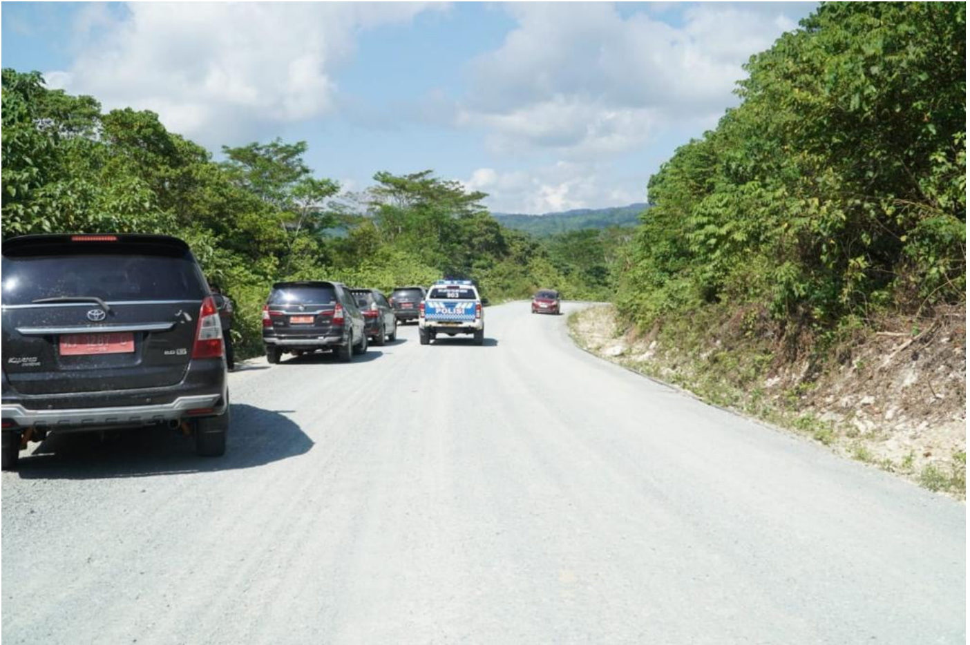
Pembangunan Jalan Sinondok-Landas akan memangkas 7 km dari ruas jalan yang ada.