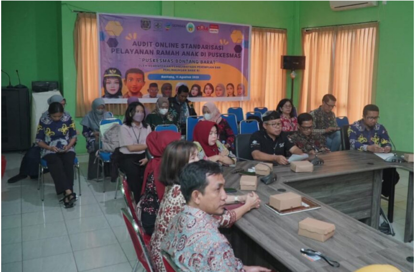
Audit pelayanan ramah anak di Puskesmas Bontang Barat.