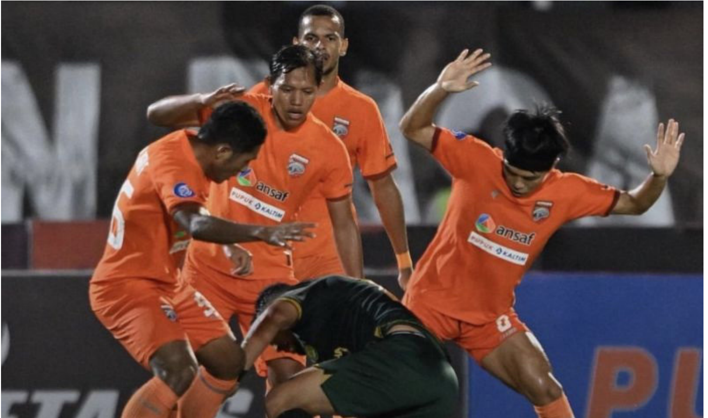
Pemain periskabo mendapat hadangan tiga oemain Borneo FC pada lanjutan Liga 1 2013 di Stadion Segiri Samarinda.