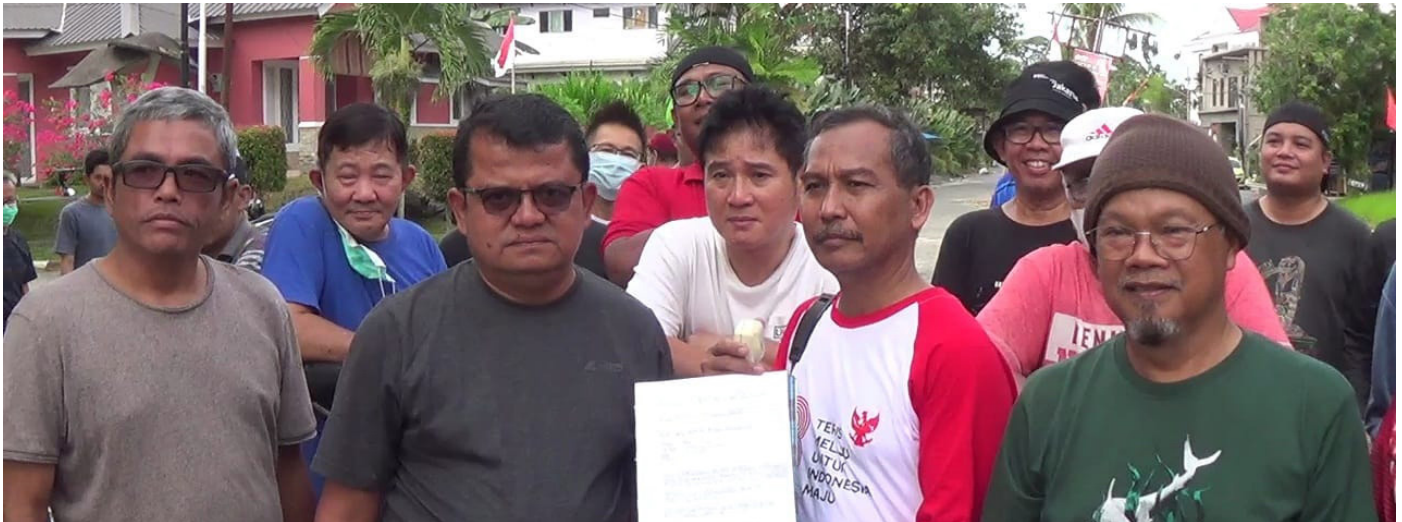
Warga RT 15 GSB, Balikpapan Utara saat memintai penjelasan dari PT Fahreza soal normalisasi jalan rusak di lingkungan RT 15.