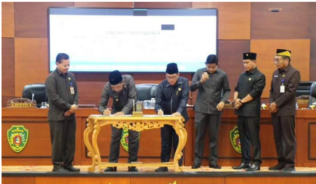
Penandatanganan nota kesepakatan KUA-PPAS APBD Perubahan 2023 dan APBD 2024 PPU, Sabtu (12/8/2023)